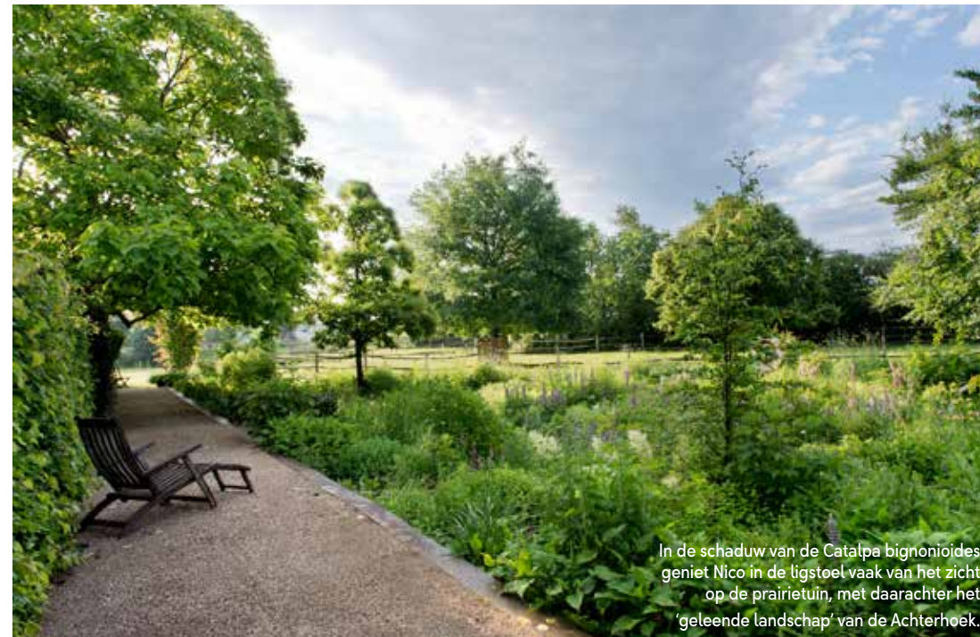
In de schaduw van de Catalpa bignonioides geniet Nico in de ligstoel vaak van het zicht op de prairietuin, met daarachter het ‘geleende landschap’ van de Achterhoek.