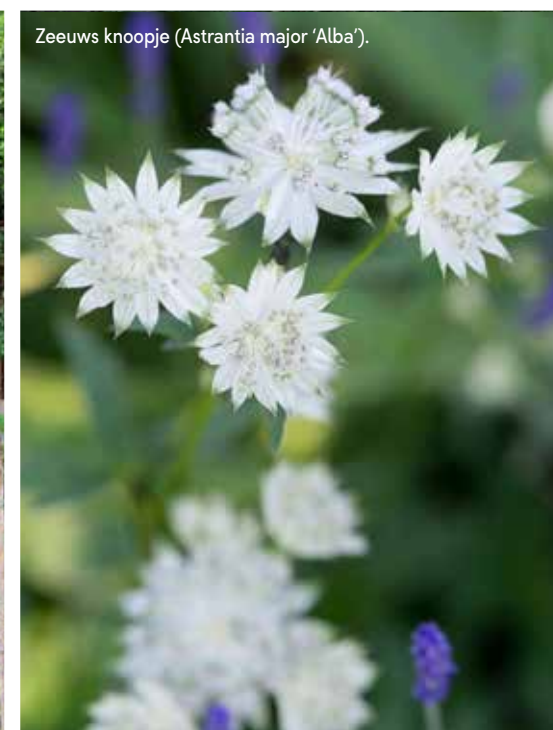
Zeeuws knoope ( Astrantia major 'Alba').