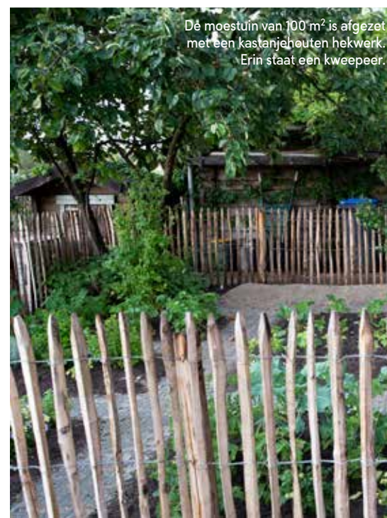
De moestuin van 100 m 2 is afgezet met een kastanjehouten hekwerk. Erin staat een kweepeer.