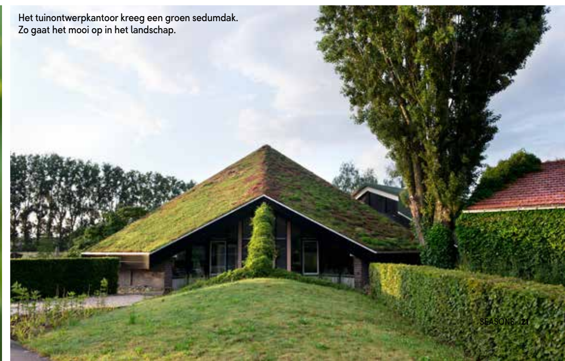
Het tuinontwerpkantoor kreeg een groen sedumdak. Zo gaat het mooi op in het landschap.