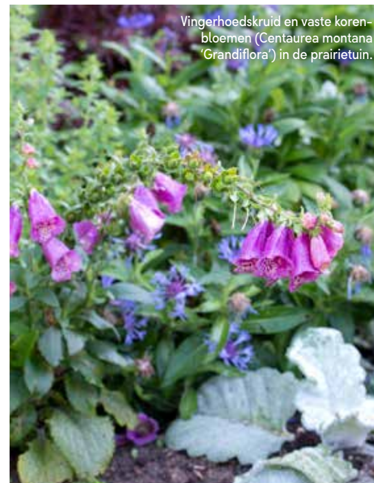
Vingerhoedskruid en vaste korenbloemen ( Centaurea montana 'Grandiflora') in de prairietuin.