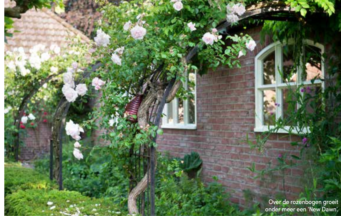
Over de rozenbogen groeit onder meer een 'New Dawn'.

De privétuin van Nico Wissing is dit jaar geopend op 30 mei, 4 juli, 1 augustus en 5 september van 12.00-16.00 uur. Check van tevoren of de dagen doorgang kunnen vinden. Groepen zijn ook welkom op afspraak. Tip: in Doetinchem en omgeving vind je diverse bijzondere ontwerpen van Nico's hand. Zo realiseerde hij er de Waterschapstuin, waarin hij al experimenteerde met de 'superweide'. Ook de lokale Stadstuin is van zijn hand. Samen met tuinontwerpers Piet Oudolf en Jacqueline van der Kloet bouwt Nico momenteel aan het 'Park of Dutch Dreams' in hartje Doetinchem, dat volgend jaar opent. Meer informatie en voorbeelden van projecten vind je op www.nicowissing.com