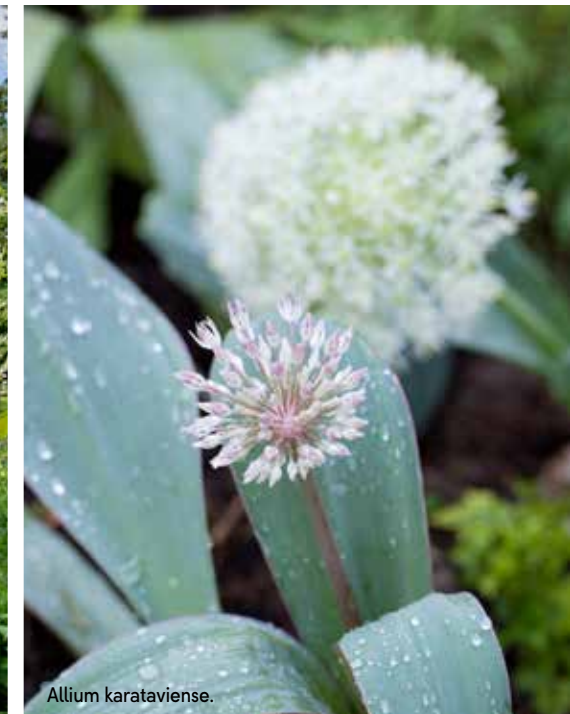
Allium karataviense .