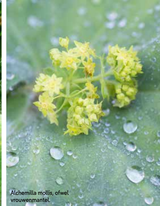
Alchemilla mollis , ofwel vrouwenmantel.