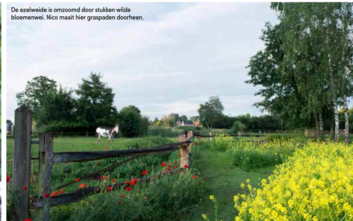
De ezelweide is omzoomd door stukken wilde bloemenwei. Nico maait hier graspaden doorheen.