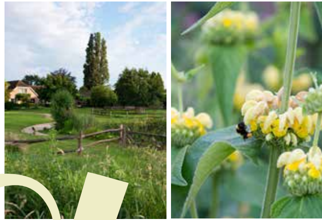
Zicht op het woonhuis vanaf de weide bij de natuurlijke vijver. Rechts: Phlomis russeliana .